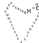
Mon cœur pareil à une flamme renversée.

À toi de jouer ! Pour t'exercer, tu peux, par exemple , choisir un proverbe pour l'illustrer en utilisant le calligramme. En voici un exemple :