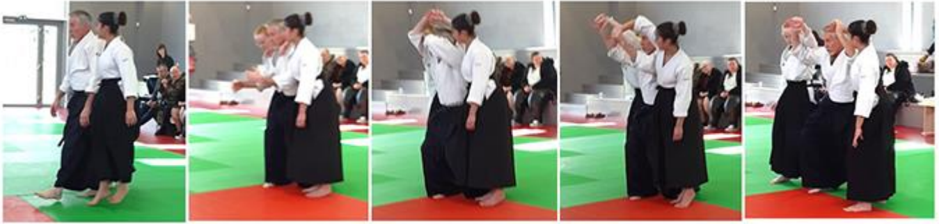
Question d'un enfant : et si mes agresseurs sont deux ?