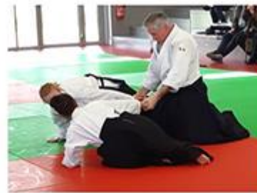
À l'écoute, une démonstration en réponse