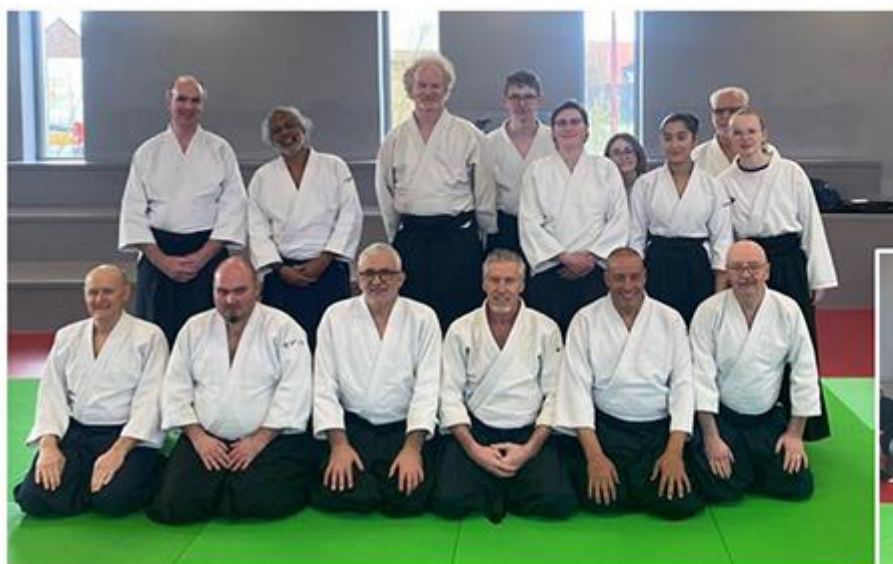
Les participants à la formation Enseignants Jeunes. Et, parmi eux, la présence insigne d'adolescentes des clubs de Caudry et Wallers. Saluons les représentants de Picardie, de Martinique et de Belgique !