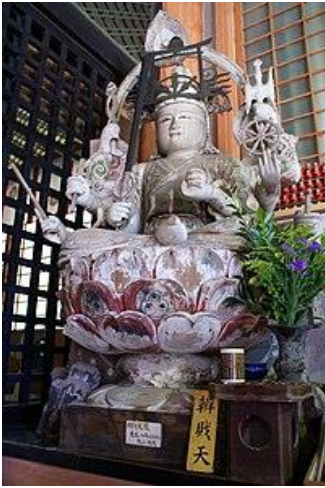
Statue de Benzaiten au Hōgon-

Benzaiten (弁財天 2 ) est une divinité bouddhiste japonaise et hindoue (Sarasvatī) du savoir, de l'art et de la beauté, de l'éloquence, de la musique, de la littérature, des arts et des sciences, de la vertu et de la sagesse, de la prospérité et de la longévité. Elle fait partie des Sept Divinités du Bonheur. Elle est aussi considérée comme l'une des divinités guerrières les plus puissantes.